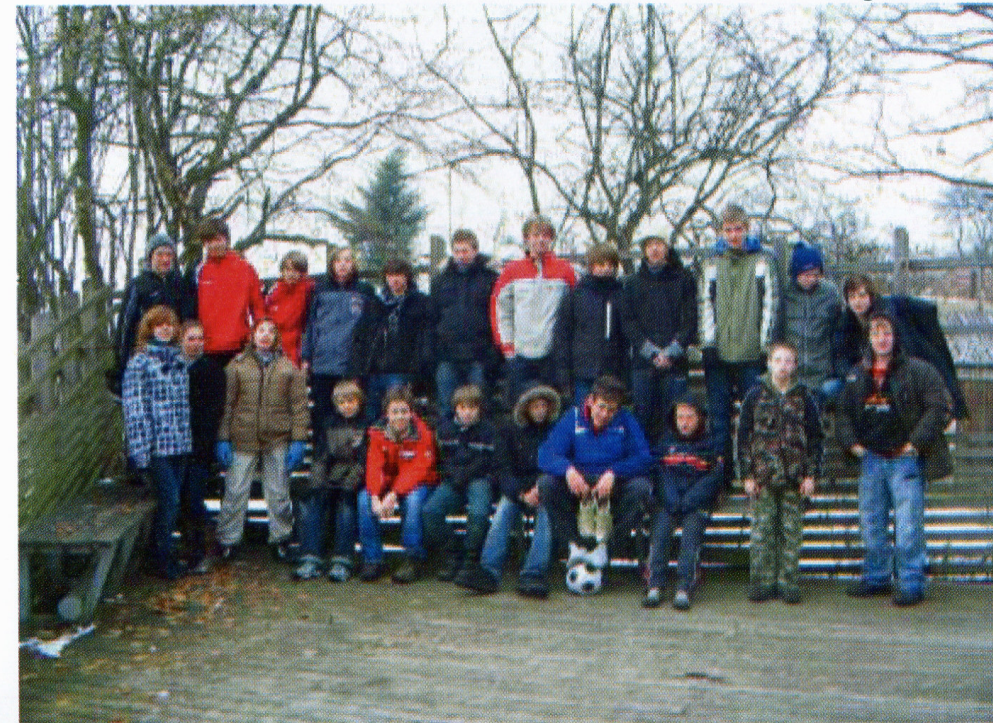
Konfirmanden on tour in Schornweisach vom 16.1.-18.1.2009