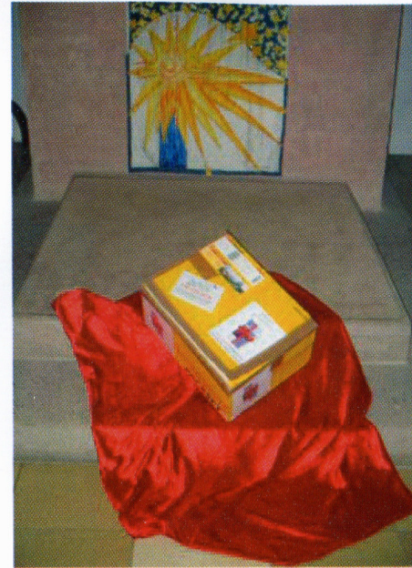
Geschenkpaket der Landeskirche Gemeindefahrt nach Speichersdorf