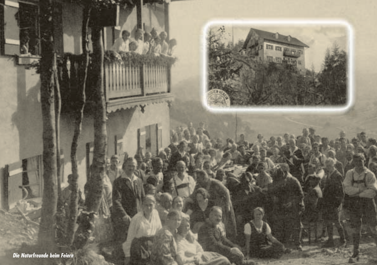
Die Naturfreunde beim Feiern