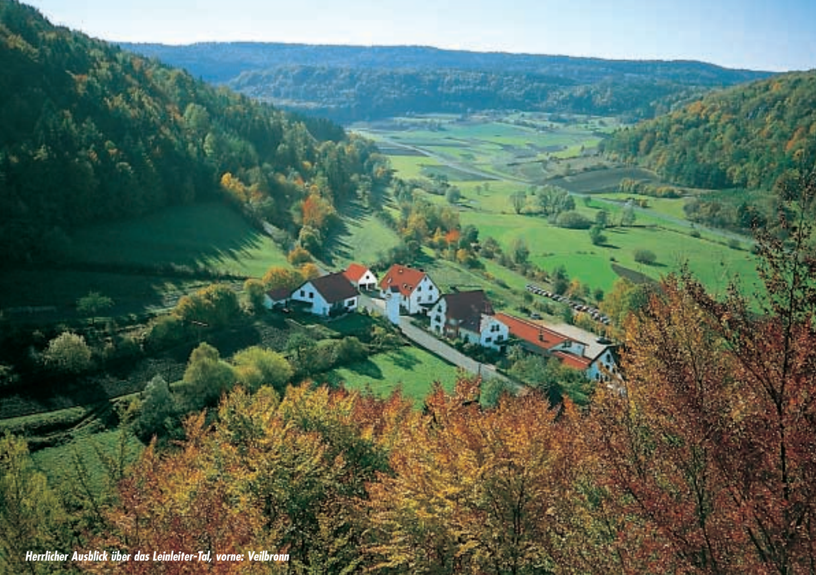
Herrlicher Ausblick über das Leinleiter-Tal, vorne: Veilbronn