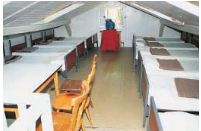
Das Bettenlager für Wanderfreunde in der Herberge (Haus II)