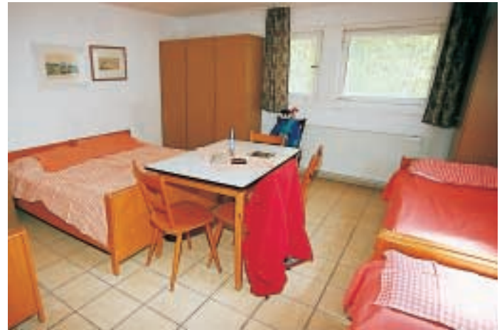
Fünfbett-Zimmer in der Herberge (Haus II)

“rustikalen und zünftigen” Übernachten für echte Bergwanderer sowie auch für manche finanziell noch etwas geschwächte Jugendgruppe ist unter dem Dach mit 12 Betten zu finden. Ein kleiner Kinderspielplatz ist vor dem Haus angelegt. Eine große Liege- und Spielwiese, neben unserem Parkplatz, ca 250 m vom Haus entfernt, steht unseren Gästen zum Sonnenbaden, Ballspielen oder sonstigen Aktivitäten, wie auch unseren kleinen Gästen zum Austoben zur Verfügung. Das Haus ist mit dem Auto über die Ortschaft Siegritz (siehe Ausschilderung), und zu Fuß über einen gesicherten Steig von der unterhalb liegenden Ortschaft Veilbronn zu erreichen.