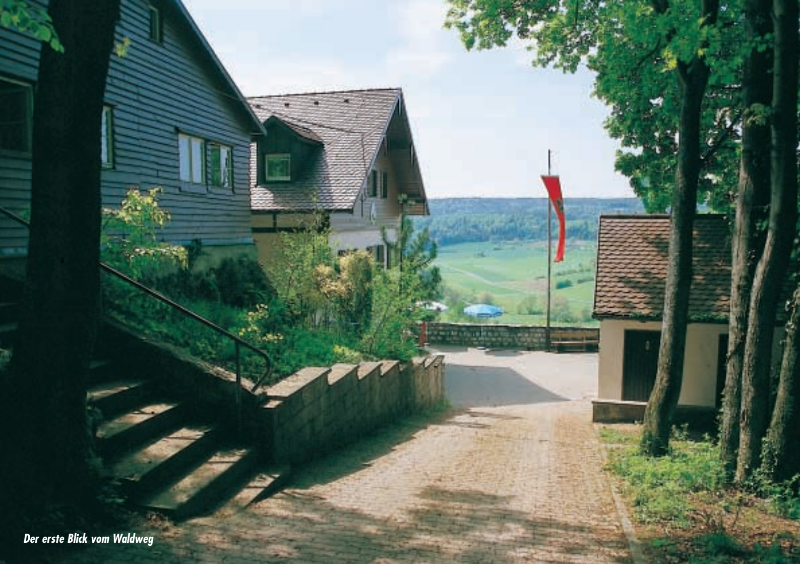
Der erste Blick vom Waldweg