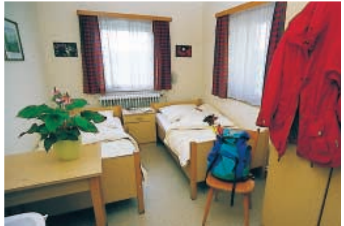
Nach einer langen Wanderung ist gut ruhen