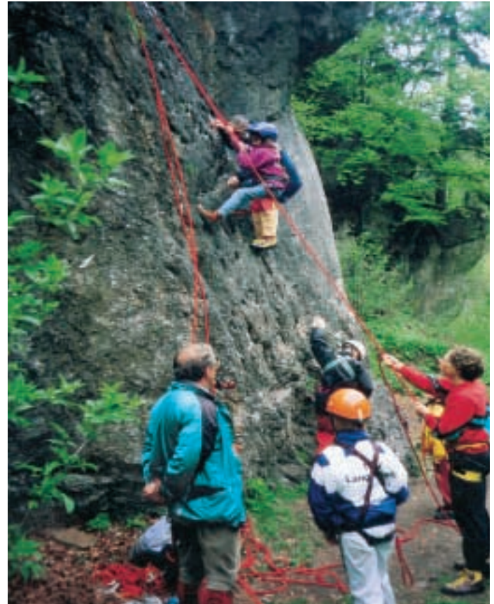
Paradies für alle Kletterfreunde, bereits die Kids sind mit viel Freude dabei

Kulmbach oder Bayreuth eine zusätzliche Bereicherung und auf alle Fälle lohnenswert.