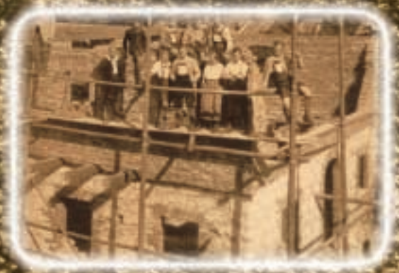
Die "Schinderei" ist vorbei: Grund zum Feiern