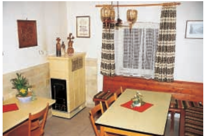
Das Betz-Zimmer – urige Gemütlichkeit

Im Haus II (Herberge) befindet sich ein heller Aufenthaltsraum, der 15 Gästen Platz bietet. Ebenerdig gibt es ebenfalls ein Fünfbett-Zimmer, ein Siebenbett-Zimmer, sowie einen Duschraum und getrennte Toiletten für Damen und Herren. Das Lager zum