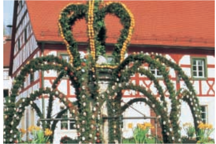
Der Osterbrunnen in Heiligenstadt

...haben sich, Gott sei's gedankt, seit dem Bestehen des Hauses nicht wesentlich verändert. Das "Romantikzeit-Gefühl" ist trotz der im Laufe der Jahre veränderten Infrastrukturen und den Zwängen der Gemeinden, sich der Zeit anzupassen, immer noch vorhanden und erlebbar. Allein der Blick von der Hausterrasse das Leinleitertal aufwärts bis zum Altenberg und nach Herzogenreuth, sowie der Ausblick das Tal abwärts über die Hänge des Müllersberges bis zu den Höhenzügen des Wiesentales und auch der westwärts gerichtete Blick zu den Felswänden des Totensteines vermittelt ein Gefühl der Erhabenheit, der Ruhe und des Ewigen. Die Natur, im Frühjahr mit prangenden Rotbuchen und Bergahorn, im Sommer mit blühendem Frauenschuh, Türkenbundlilien und verschiedenen Orchideen bis hin zum Herbst mit seinen verschwenderischen Pastellfarben, läßt uns erahnen und letztlich wissen, was unser kostbarstes Gut ist und gibt die Kraft, unser Ziel nicht aus den Augen zu verlieren. Die Wandermöglichkeiten und Se-