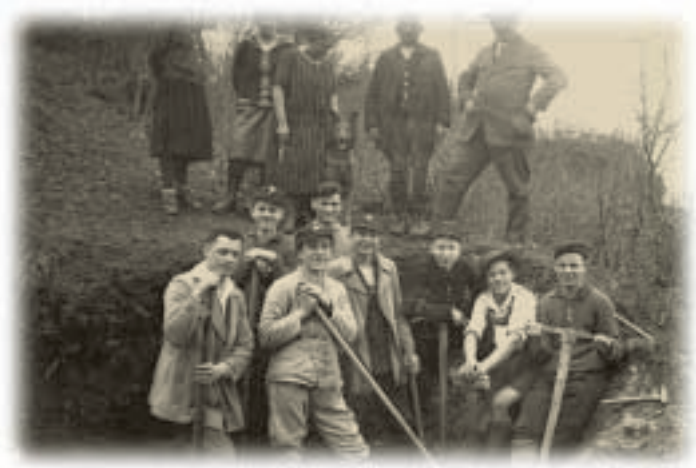
Die Mannschaft der ersten Stunde

1895 wurde die internationale Naturfreunde-Bewegung in Wien gegründet. Der geistige Hintergrund dieser Initiative war, den Menschen damals zu Beginn des Industrie-Zeitalters und des beginnenden modernen Tourismus einen Weg zu zeigen, der sie aus ihren rauchigen engen Werkstätten, Fabriken, Büros und finsternen Hinterhöfen herausführt. Die Vision war, einer breiteren Bevölkerungsschicht Freiheit in der Natur, kulturelle Betätigung und politische Selbstverantwortung anzubieten und zu ermöglichen. Kurzum: eine andere, bessere Lebensqualität für den damaligen arbeitenden Menschen zu schaffen. Heute haben die Naturfreunde über 600.000 Mitglieder weltweit und über 1000 Naturfreundehäuser in Europa und Übersee.