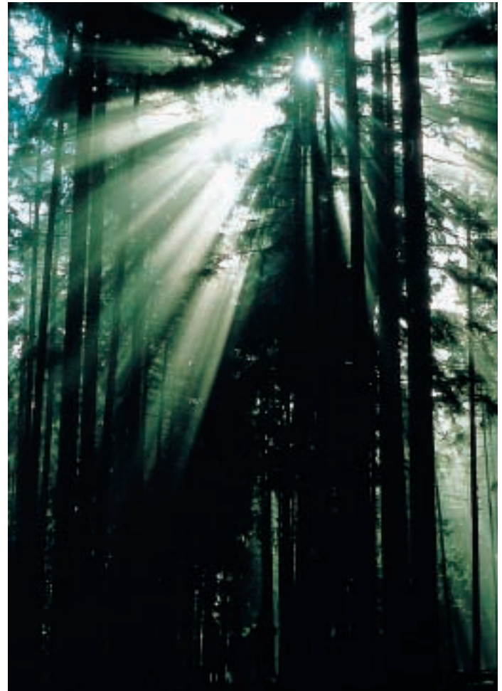
Die Sonne verzaubert den Wald

“Fürther Naturfreunden”. Die Naturfreunde-Fahne winkte wieder von ihrem angestammten Platz ins Leinleiertal hinab. In der folgenden Zeit folgten Arbeitsdienst um Arbeitsdienst, um die beträchtlichen Schäden, die durch das “Tausendjährige Reich” entstanden waren, zu beseitigen. Wegen des hohen Materialaufwandes und mancher Fremdkosten mußten mehrere Darlehen aufgenommen werden, wobei der Zuschuß durch die Wiedergutmachungsgesetze relativ gering ausfiel und nur der sogenannte “Tropfen auf dem heißen Stein” war. Kurzfristig wurde dann das Haus ein paar Jahre lang bis 1956 vom Landesverband der Naturfreunde bewirtschaftet, bis die Ortsgruppe es wieder übernahm. Durch die ständig anfallenden Arbeiten, wie Hauserweiterungen, Klärgrubenbau, Einbau sanitärer Einrichtungen, Terrassenerweiterung, Anschluß an die Wasserversorgung der Leinleitergruppe, um nur die wichtigsten zu nennen, mußte 1959, im Jahr des 50-jährigen Vereinsjubiläums, wieder ein umfangreiches Darlehen aufgenommen werden. Die Stadt Fürth wie auch das Bay. Kultusministerium unterstützten dabei den