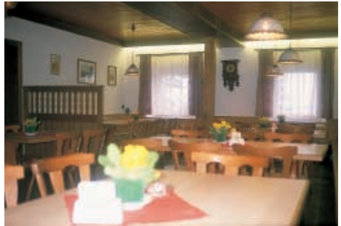
Gastlichkeit wird groß geschrieben

Heute, im Jahr 2000, werden das Haus, wie auch das Nebenhaus, wie schon erwähnt, an den Wochenenden und Feiertagen von unseren engagierten Hausdiensten ehrenamtlich betreut und bewirtschaftet. In Ausnahmefällen und bei rechtzeitiger Anmeldung von Gruppen ist es möglich, das Haus I, wie auch die Herberge (Haus II) an Wochentagen und auch wochenweise anzumieten. Leider ist eine Selbstversorgung in beiden Häusern nicht möglich. Da wir dem heutigen Wanderer und Besucher unseres Hauses einen zeitgemäß angenehmen und relativ komfortablen Aufenthalt zu allen Jahreszeiten bieten möchten, sind beide Häuser zentralbeheizt, mit Etagentoiletten für Damen und Herren, sowie mit Duschen versehen. Im Hauptgebäude befindet sich