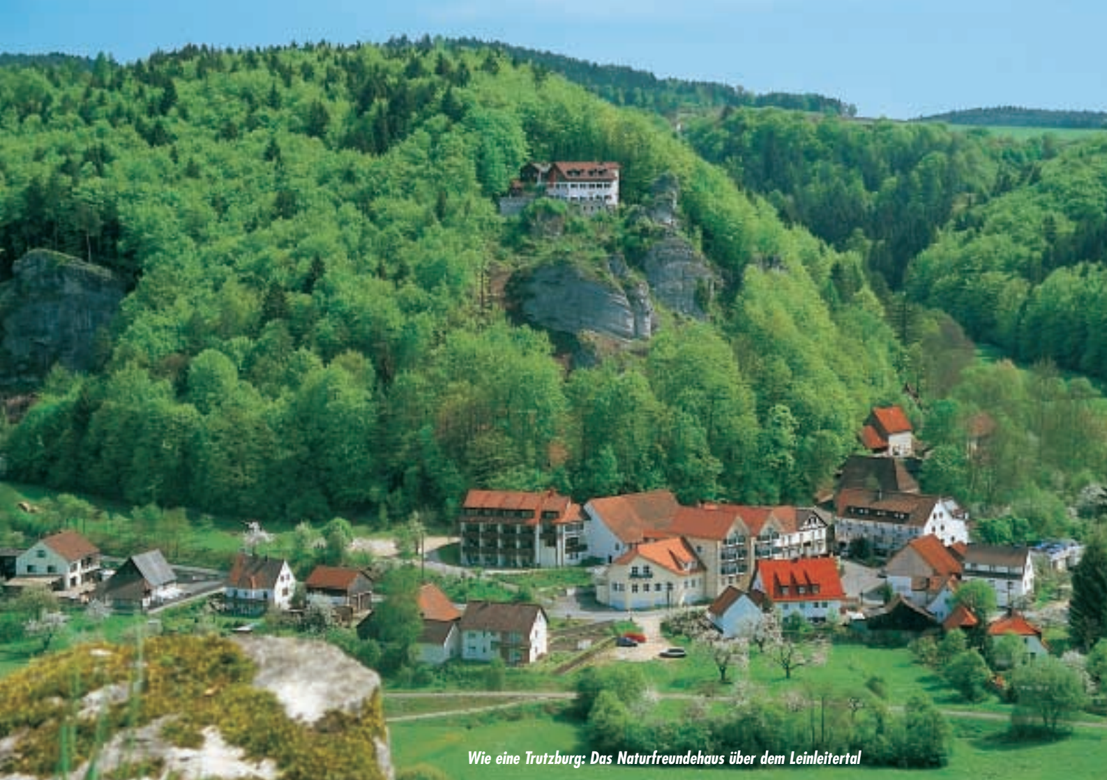
Wie eine Trutzburg: Das Naturfreundehaus über dem Leinleitertal