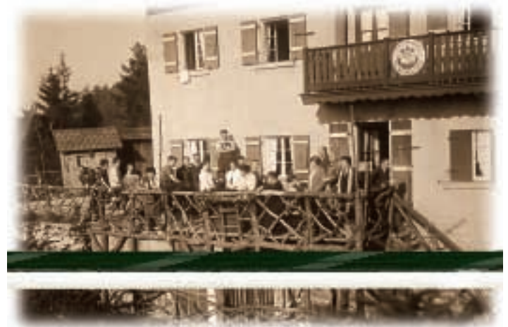
Der alte Balkon lud zum Verweilen ein

Verein mit großzügigen Zuschüssen. Auch die Spendenfreudigkeit der Vereinsmitglieder wurde zu jener Zeit auf eine harte Probe gestellt. Ab den 70er Jahren wurde allen Verantwortlichen klar, daß das Haus, um den gestiegenen Ansprüchen ihrer Gäste zu genügen, eine neuerliche Modernisierung brauchte. Ausbau der Übernachtungsräume, der Küche, der Aufenthaltsräume, der sanitären Einrichtungen und schließlich der Einbau einer Zentralheizung standen auf dem Programm. Wieder stand die Beschaffung des leidigen Geldes