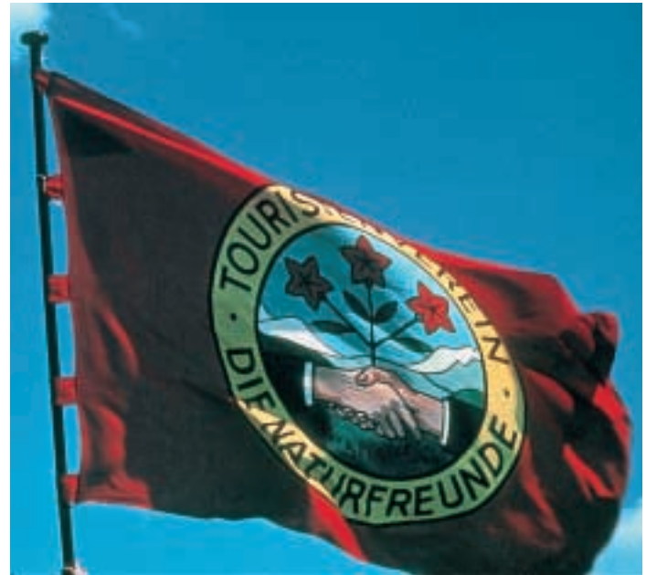
Wenn die Fahne der Naturfreunde weht, ist die Tür für alle Wanderer offen