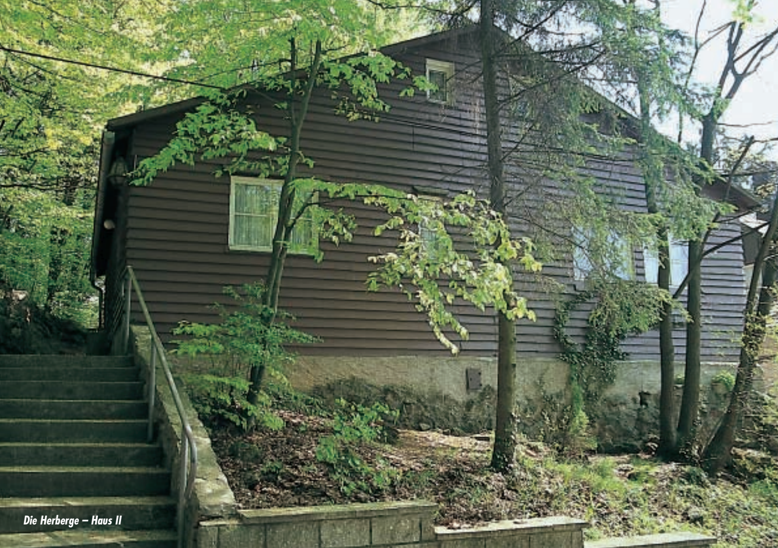
Die Herberge – Haus II