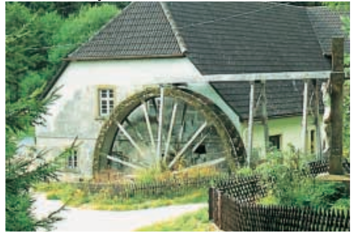
Ein Idyll: Die Heroldsmühle