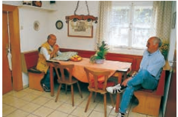
Aufenthaltsraum in der Herberge (Haus II)