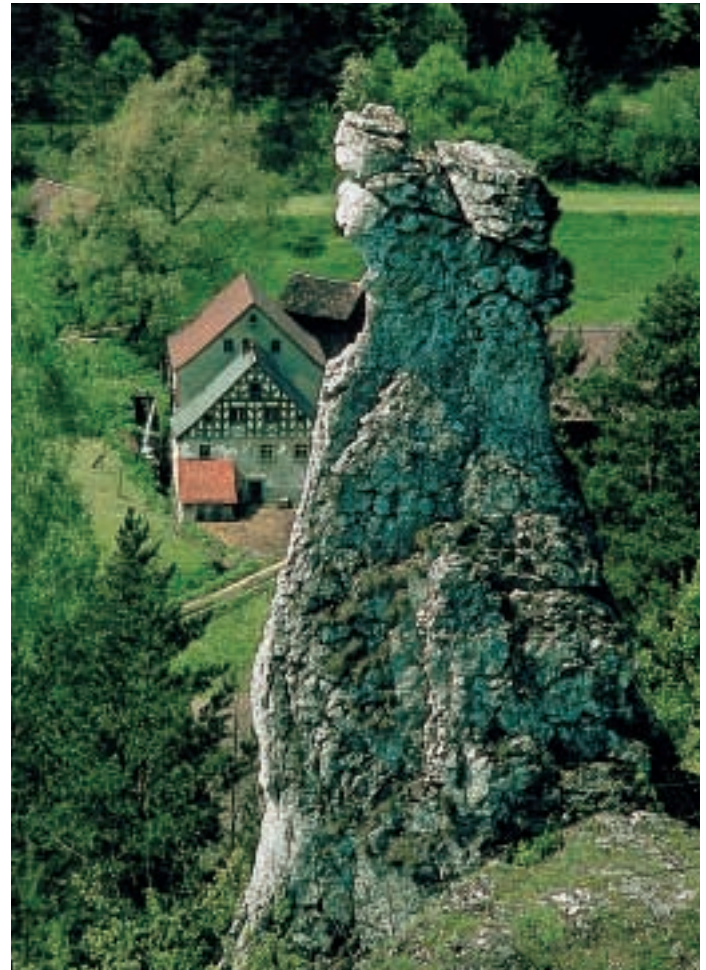
Der Pferdekopf – Wahrzeichen von Veilbronn

Den Verantwortlichen der Fürther Naturfreunde bleibt heute im Jahr 2000 nur ein herzliches Dankeschön an alle, die diese "Wärme, Nähe und Geborgenheit" unseren Wanderern und Gästen in den vielen Jahren nahebrachten und ermöglichten. Allen voran gilt unser Dank natürlich unseren ehrenamtlichen "Hausdienstlern" sowie unserer "Hauskommission". Wir danken all unseren Freunden und unterstützenden Firmen der Fürther Naturfreunde, wie auch der Stadt Fürth und der Gemeinde Heiligenstadt. Stellvertretend für alle engagierten Mitglieder sind drei Freunde besonders hervorzuheben, die sich um den Verein und das Haus besonders eingesetzt und verdient gemacht haben. Dies sind